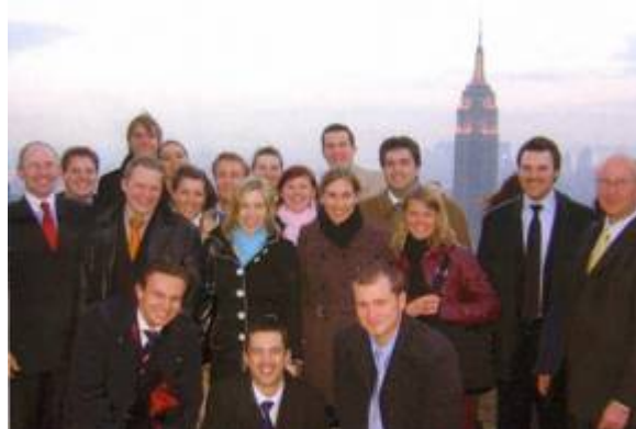
New York 2006