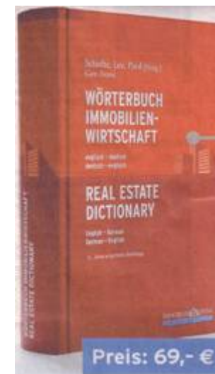
jeweils 5. Semester