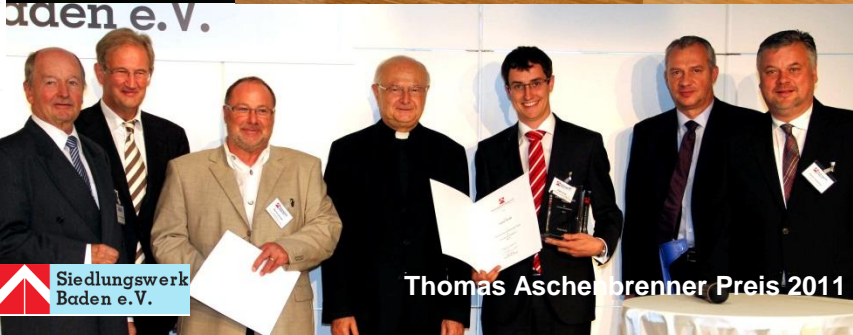
Siedlungswerk Baden e. V. Thomas Aschenbrenner Preis 2011